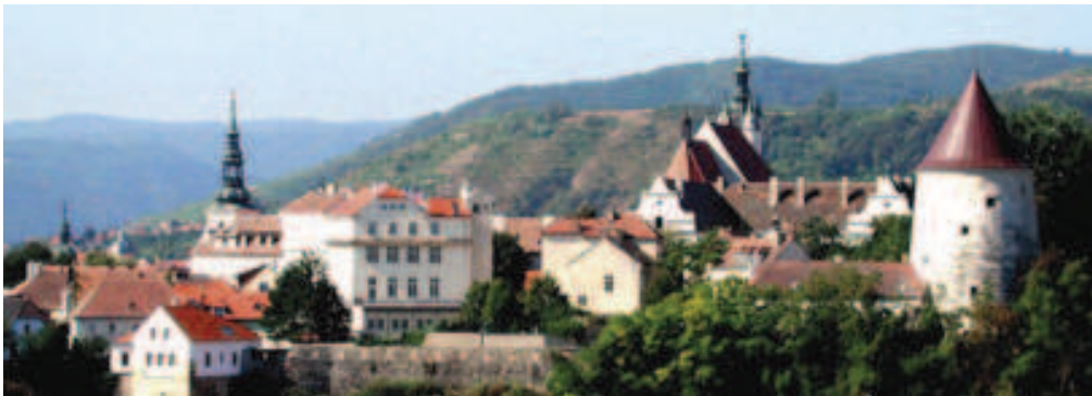
Blick auf Krems im Herbst

Nach 1971 reisten in diesem September nach 44 Jahren Pause ca. 80 Mitglieder und Gäste per Bahn, PKWs oder Flugzeug zur Herbsttagung nach Krems in die Wachau. Seinerzeit lag der Schwerpunkt der Tagung auf dem Thema der Ausstellung „1000 Jahre Kunst in Krems an der Donau“ sowie die Besichtigungen der Winzergenossenschaft Krems und des Kellerschlössls Dürnstein. 44 Jahre sind eine sehr lange Zeit und jetzt war es an der Zeit, sich von den äußerst positiven Veränderungen und Entwicklungen in Krems, im Kremstal und in der Wachau überzeugen zu lassen.